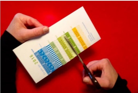
2 Letzter Einschnitt unter Muster Juni