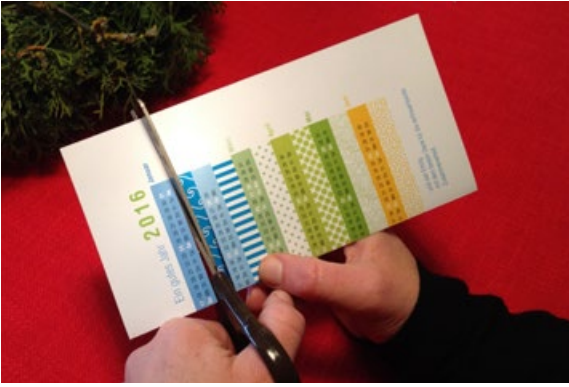
1 Einschnitt bis zum Rand unter dem Januar