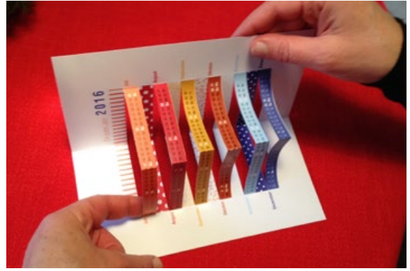
5 Auf der Rückseite erscheint das restliche Jahr