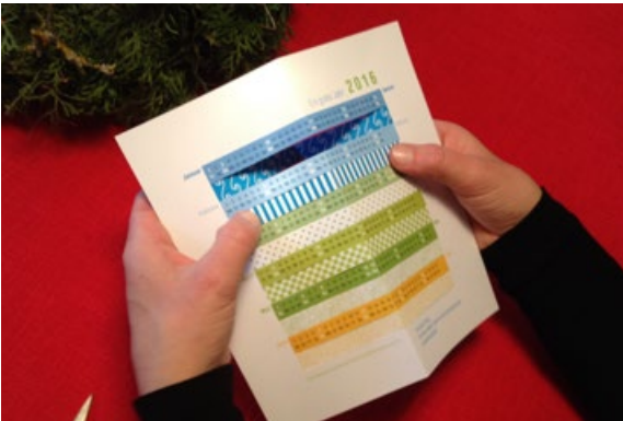
3 jetzt die Muster nach hinten biegen